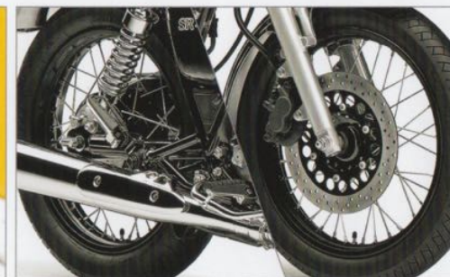
60th Anniversary専用ブラックカラーのリムとハブ(前後)