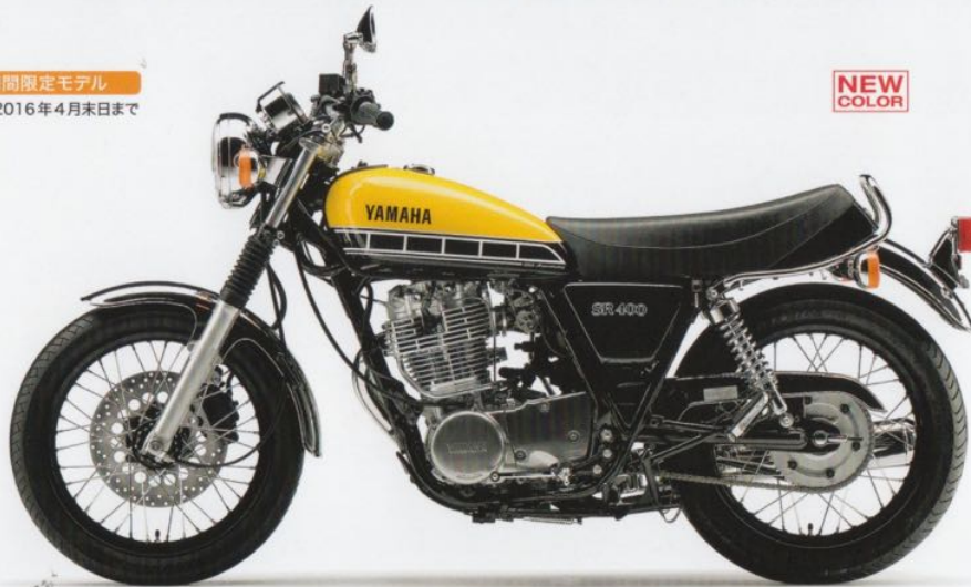
ライトレディッシュイエローソリッド1(イエロー)