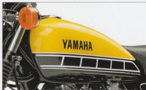
“スピードブロック”グラフィックが映える 60th Anniversary専用インターカラー